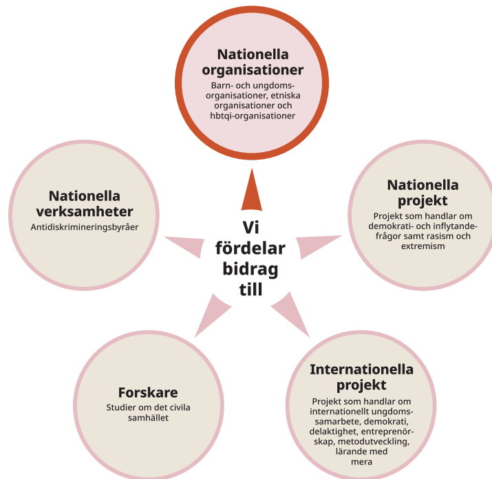
Figur 1 Illustration över de olika bidrag som myndigheten fördelar 2020

Myndigheten för ungdoms- och civilsamhällsfrågor (MUCF) är en statlig myndighet som tar fram kunskap om ungas levnadsvillkor och om det civila samhällets förutsättningar. En av våra kärnuppgifter är att fördela bidrag till föreningsliv, internationellt samarbete, kommuner och forskning. MUCF fördelar bidrag till organisationer som kan söka organisationsbidrag, projektbidrag och verksamhetsbidrag.