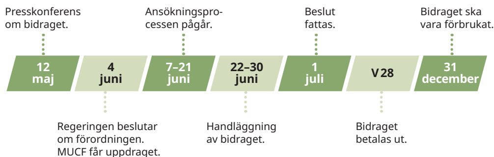
Figur 3.1 ansökningsprocessen

Ansökningsprocessen för statsbidraget har i stort följt den ansökningsprocess som MUCF har för andra bidrag som fördelas av myndigheten, med en stor skillnad, att bidraget skulle fördelas mycket skyndsamt. I detta kapitel avser MUCF att tydliggöra hur ansökningsprocessen såg ut. En illustrerad bild av tidsramen för ansökningsprocessen visas i figur 3.1 nedan.