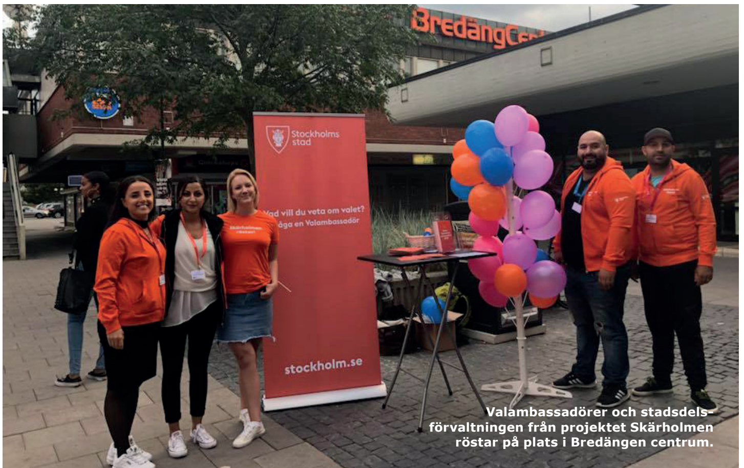
Valambassadörer och stadsdelsförvaltningen från projektet Skärholmen röstar på plats i Bredängen centrum.