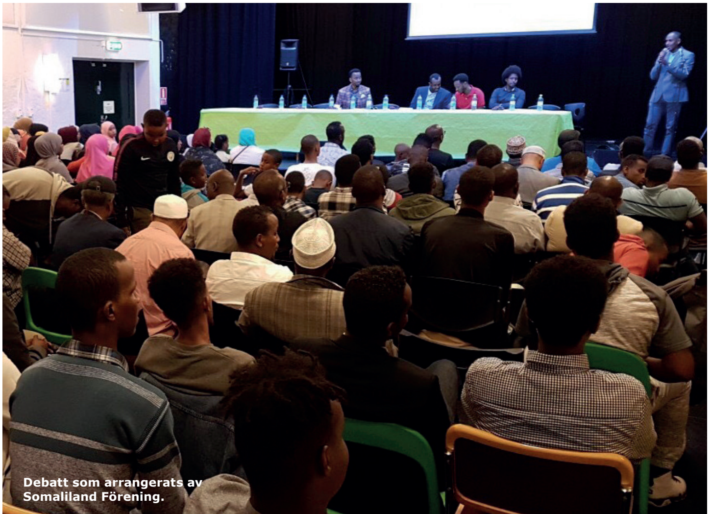
Debatt som arrangerats av Somaliland Förening.

tar att de efter projektet känner sig mer motiverade och trygga med att prata om demokrati med andra, och känner att de vill rösta i nästa val när de har rösträtt.